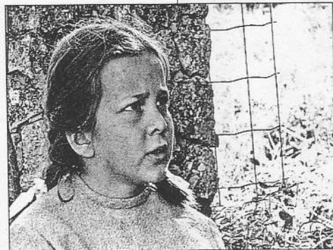
UN FILM DA VEDERE - Immagini da Ghiaie