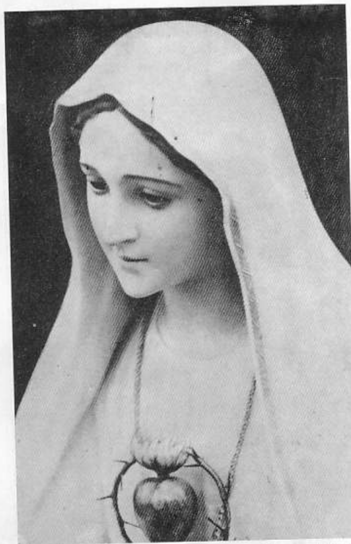
« I pochi fedeli a questo Cuore che sanguina non dubiteranno della mia potenza nell'ora nera che si avvicina ».

« Una grande guerra si scatenerà nella seconda metà del XX Secolo. Fuoco e fumo cadranno dal Cielo, le acque degli oceani diverranno vapori, e la schiuma si innalzerà sconvolgendo e tutto affondando. Milioni e milioni di uomini periranno di ora in ora, e coloro che