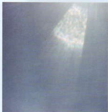
Una strada di luce scende sul luogo delle apparizioni.

"Io ero abbastanza vicina alla bambina e la vidi girare la testa verso un punto nel cielo, poi congiunse le mani e cadde in estasi. Assistetti al prodigio del sole. L'astro roteava, si ab-