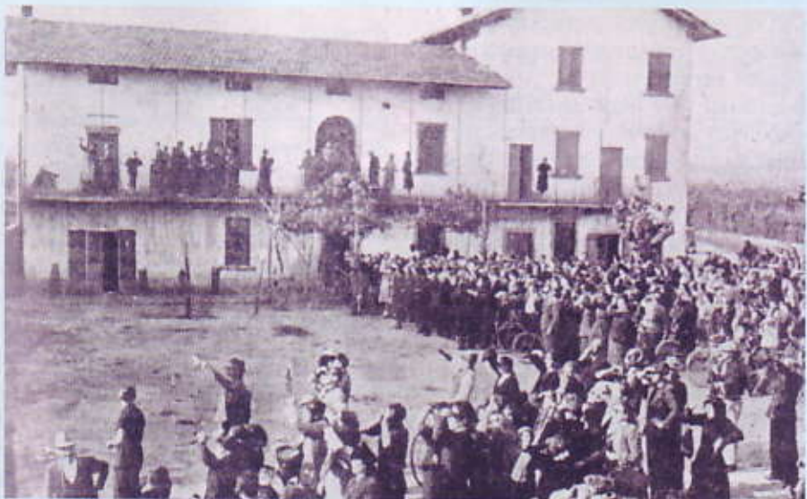
Gente davanti alla casa di Adelaide che osserva il primo fenomeno solare.

bassava e si alzava ed emetteva raggi luminosi di colore diverso che colpivano la gente e il luogo cambiando i colori dei volti e degli abiti. La gente vicino a me batteva le mani dalla meraviglia. Io ebbi molta paura perché sembrava che il disco solare cadesse nella nostra direzione. Rimasi molto colpita e ancora