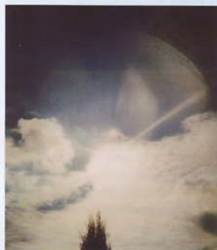
Una figura ripresa di recente nel cielo di Ghiaie come nel maggio 1944.

Come per suo naturale peso, la massa di polvere così spaziata, calava in basso a mo' di lenta ed ampia cascata che, diradando nell'atmosfera, ne diluiva il colore sino a confondersi e a sparire nel terso azzurro