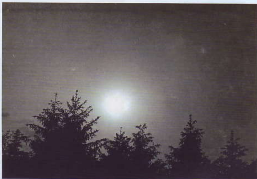
Una rara fotografia scattata durante il fenomeno solare del 21 maggio 1944.

plai uno spettacolo quale non avrei mai potuto immaginare. Il sole al tramonto presentava il suo disco in un placido colore argenteo e lo vedevo vertiginosamente roteare su se stesso, dando talvolta l'impressione che per la velocità dovesse sbandarsi nel cielo. L'occhio lo poté fissare subito, senza fatica, con un senso dolce di riposo. Ma il meraviglioso non fu tutto qui. Nella sua roteazione il sole, quale girandola creata dal più bravo mago di fuochi d'artificio, lanciava fasci di luce or gialla, or verde, or violetta, con una vivezza tale, che le nubi attorno al sole ne erano meravigliosamente investite e