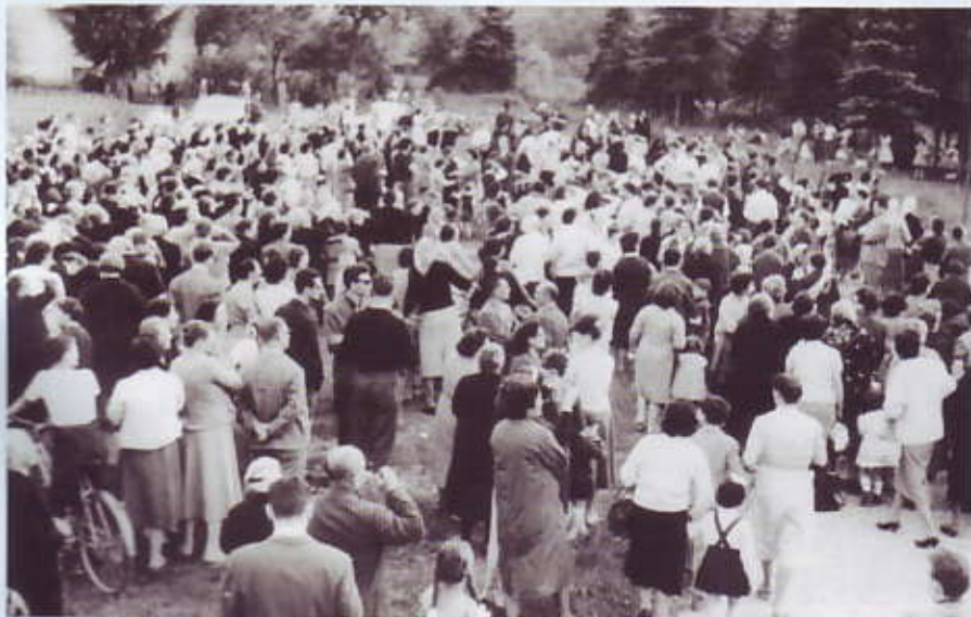
Gente che osserva il fenomeno solare del 13 maggio 1959.

del cielo. Tosto il fenomeno si ripeteva con successive vivaci tinte: blu, rosso, giallo, verde, ecc., sempre catapultate in massa dal centro del sole alla solita maniera, per scendere, diramare e spegnersi nello stesso modo. Tale fenomeno durò più di mezz'ora...".