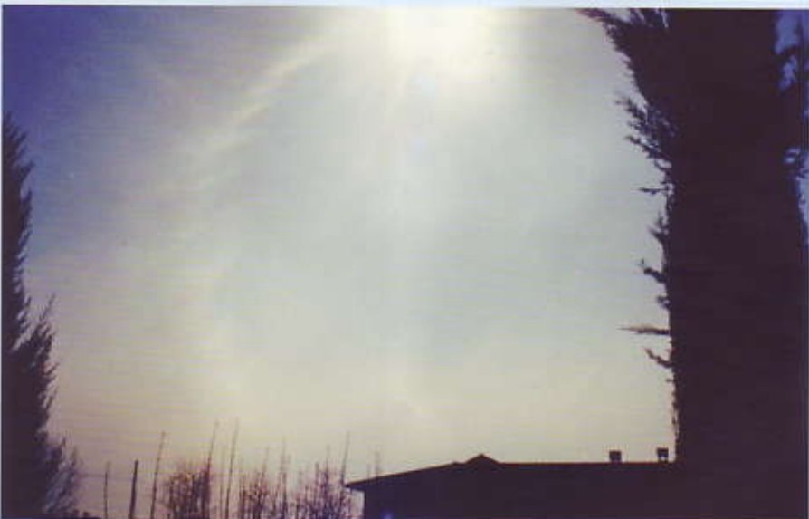
Un recente fenomeno del sole rotante simile a quello del maggio 1944.