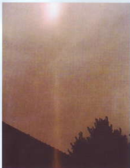
Una croce di luce ripresa di recente sul luogo delle apparizioni.

corse sul luogo delle apparizioni. Si manifesterà nel 1953 e nel 1959 e periodi successivi.