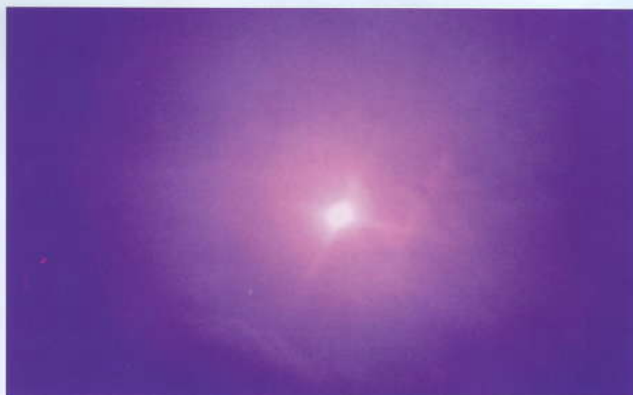
Un fenomeno solare avvenuto recentemente a Ghiaie di Bonate

"Il sole, splendente senza abbaglio, velocemente roteava su se stesso con movimento eccentrico, mutando la luce nei più svariati colori: dal più intenso blu, al rosso vivo, dal