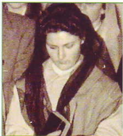
Adelaide a Roma, nel 1954 da Padre Candido.

ghigno terrificante, dalla coda mobilissima, dalla bocca avida di distruzione, dalle corna minacciose, armati di spiedi tali da cucinare un intero reggimento di bambine ansiose commedianti e bugiarde del suo tipo. Le notti si fanno tempestose...".