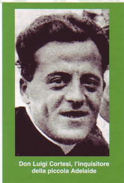
Don Luigi Cortesi, l'inquisitore della piccola Adelaide

Nell'articolo di ottobre, vi ho raccontato, seppur sinteticamente, il calvario cui è andata incontro la veggente di Ghiaie, Adelaide Roncalli, per la sola colpa di aver visto la Madonna e la Sacra Famiglia. In questo numero, voglio ora illustrarvi quali furono i metodi e le tecniche manipolatorie che utilizzò l'inquisitore don Luigi Cortesi per costringere quella bambina, che nel 1944 aveva solo sette anni, a negare le apparizioni. Durante gli anni di segregazione in istituti religiosi (tra il 1944 e il 1947), Adelaide fu alla completa mercé di quel sacerdote, "insidioso indagatore", che non credeva nella veridicità delle apparizioni avvenute nel maggio 1944 a Ghiaie di Bonate. Don Cortesi volle dimostrare ad ogni costo che Adelaide era una bugiarda e un'indemoniata. Considerando "tutta sua" la bambina, gli fu gioco facile suggestionarla, confonderla inculcandole dubbi atroci, e terrorizzarla con le paure dell'inferno e del peccato mortale per strapparle una ritrattazione scritta. Ecco alcune delle tecniche manipolatorie, mol-