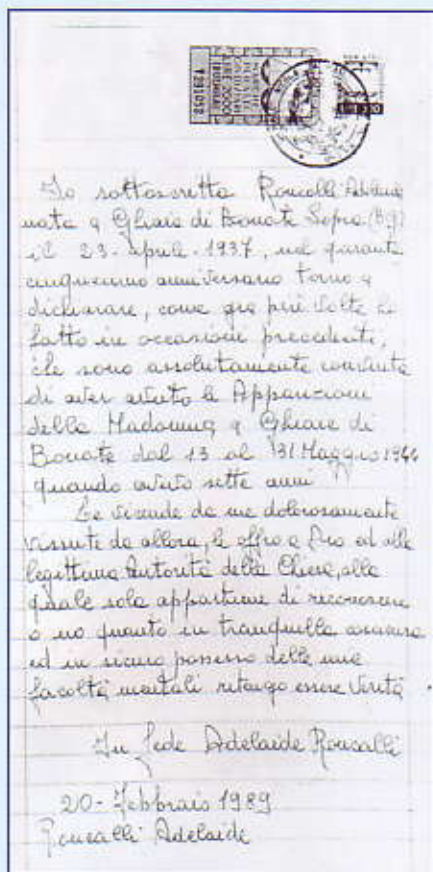
La solenne riaffermazione del 20 febbraio 1989.