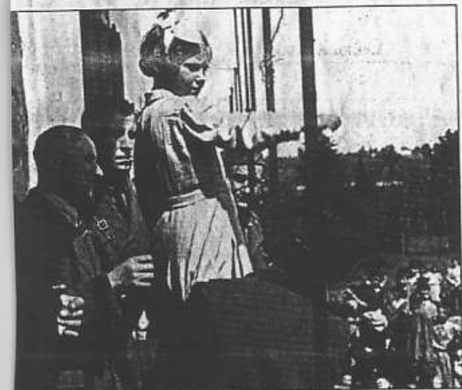
In un'immagine tratta dal volume pubblicato in questi giorni

apparizioni e quella del martirio della bimba