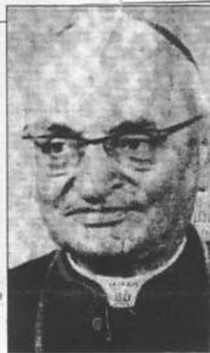
■ Monsignor Battaglia