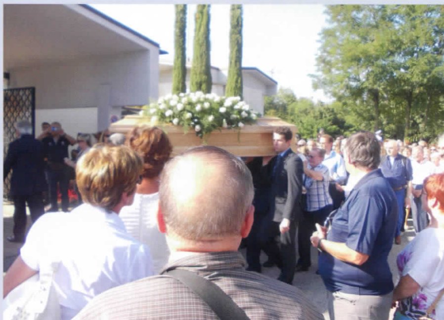
La bara viene portata a spalla all'interno del cimitero di Ghiaie di Bonate.

(sembra verbalmente) a dire, quando vuole, la messa alla Cappelletta, soprattutto nel mese di maggio. E non è tutto! Corrono voci sempre più insistenti che, un paio di anni fa, l'attuale vescovo di Bergamo, mons. Francesco Beschi, abbia istituito, fuori diocesi, una Commissione "imparziale" formata da religiosi e laici, con il compito di rileggere tutto l'incartamento sui Fatti di Ghiaie di Bonate. Ma quale incartamento? Se esiste veramente questa Commissione, spero che possa con calma e competenza esaminare e studiare attentamente tutta la documentazione. E non solo sintesi fatte frettolosamente da chi, incaricato di riordinare