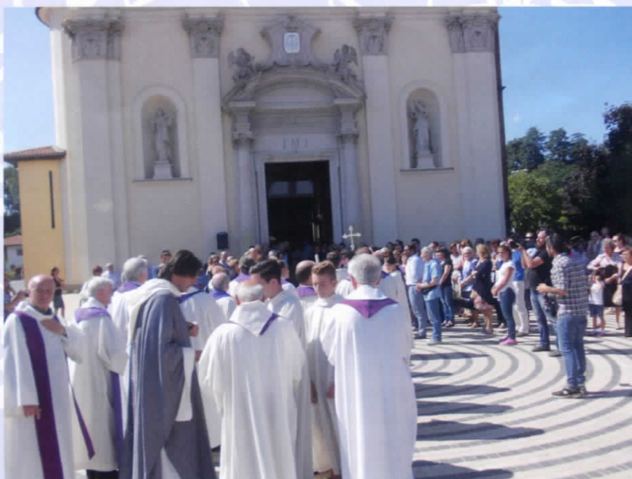
Un corteo di oltre 20 sacerdoti si dirige verso la chiesa per officiare i funerali.