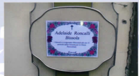
La partecipazione esposta fuori della chiesa.