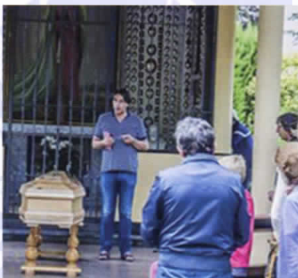
Preghiere davanti al feretro alla Cappelletta delle apparizioni, il 25 agosto 2014.