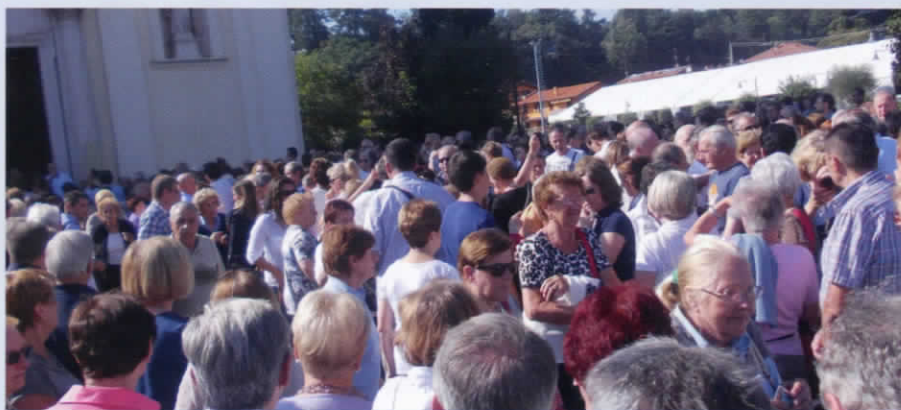
Una marea di gente in attesa dell'uscita del feretro dalla chiesa, il 27 agosto 2014.