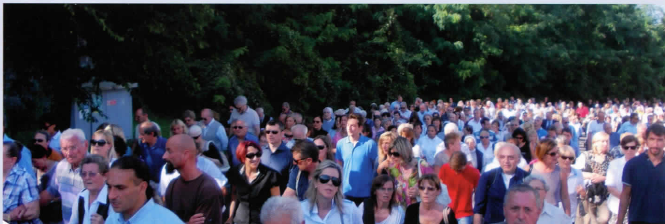
Una folla immensa segue il feretro verso il cimitero di Ghiaie, il 27 agosto 2014.