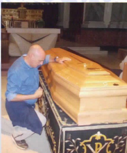
Paolo Brosio in preghiera accanto alla bara di Adelaide, il 26 agosto 2014.

l'ora dei funerali, l'assalto delle "troupe" televisive e dei giornalisti è diventato più pressante. I funerali si sono svolti alle 15.00, officiati dal parroco e da una ventina di sacerdoti. Numerosa la presenza delle suore, soprattutto quelle dell'ordine delle Sacramentine, che sono sempre state vicine ad Adelaide. Alla fine delle esequie, l'uscita del feretro è stata salutata con grandi applausi. È stato un continuo spingersi per giungere vicino alla bara e dare un'ultima carezza ad Adelaide.