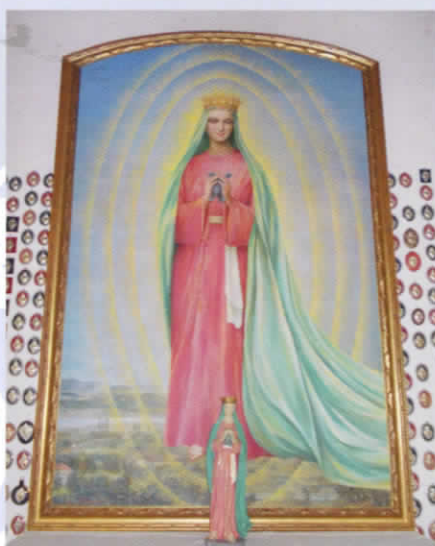
La pala d'altare della pittrice Balzarini esposta dal 1° maggio 2014 alla Cappelletta delle apparizioni.

(sembra verbalmente) a dire, quando vuole, la messa alla Cappelletta, soprattutto nel mese di maggio. E non è tutto! Corrono voci sempre più insistenti che, un paio di anni fa, l'attuale vescovo di Bergamo, mons. Francesco Beschi, abbia istituito, fuori diocesi, una Commissione "imparziale" formata da religiosi e laici, con il compito di rileggere tutto l'incartamento sui Fatti di Ghiaie di Bonate. Ma quale incartamento? Se esiste veramente questa Commissione, spero che possa con calma e competenza esaminare e studiare attentamente tutta la documentazione. E non solo sintesi fatte frettolosamente da chi, incaricato di riordinare