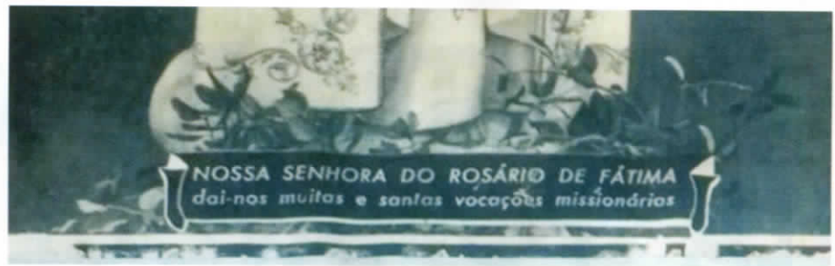
La scritta in portoghese sotto l'immagine della Madonna