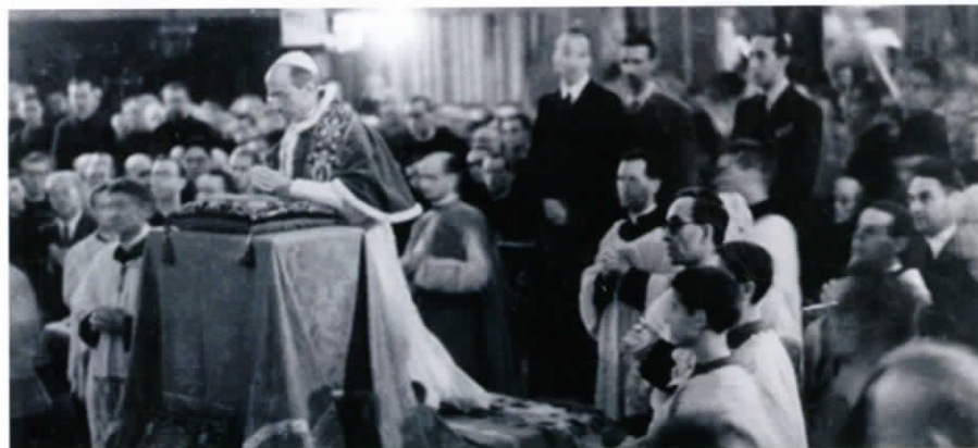
Pio XII in preghiera davanti all'icona della Madonna del Divino Amore