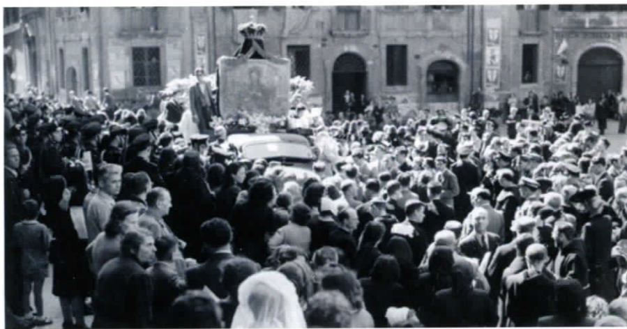
L'icona della Madonna del Divino Amore accolta trionfalmente