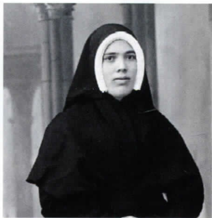
Suor Lucia di Fatima

"Verso la fine della guerra, la Madonna apparirà in Italia a una bambina di sette anni di una famiglia povera, in un piccolo paese, per proteggere il Papa e aiutare il mondo".