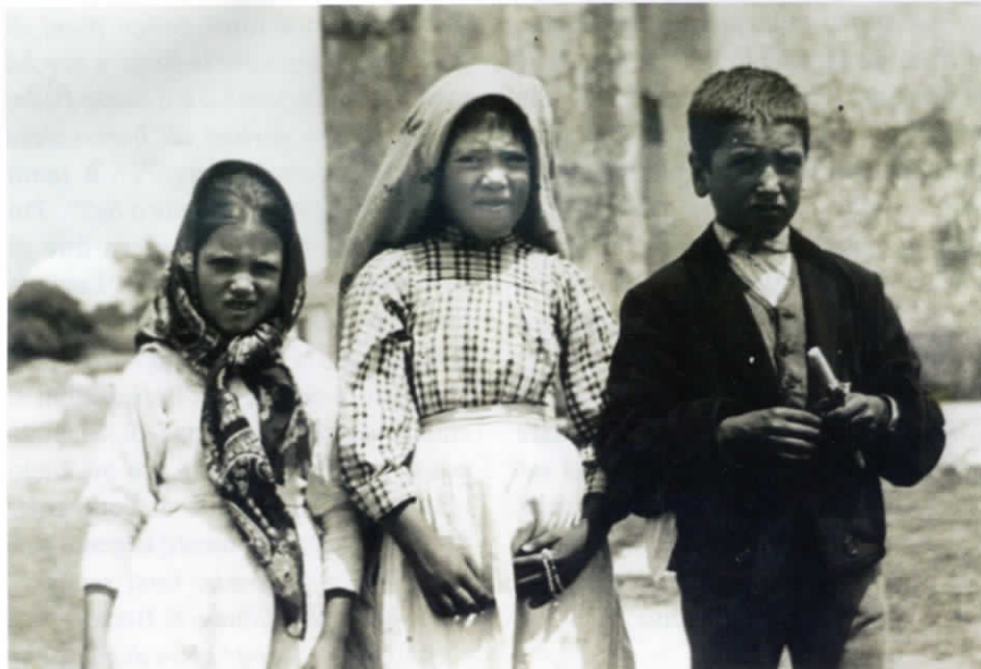
Giacinta, Lucia e Francisco, i tre pastorelli di Fatima

Finalmente, l'11 giugno 1944, il Papa poté recarsi nella chiesa di Sant'Ignazio ed elevare la sua preghiera di ringraziamento ai piedi della Madonna del Divino Amore. "Noi oggi siamo qui - disse allora Pio XII - non solo per chiedere i suoi celesti favori, ma innanzitutto per ringraziarla di ciò che è accaduto, contro le umane previsioni nel supremo interesse della Città eterna e dei suoi abitanti... La nostra Madre Immacolata ancora una volta ha salvato Roma da gravissimi imminenti pericoli... ha ispirato, a chi ne aveva in mano la sorte, particolari sensi di reverenza e di moderazione" .