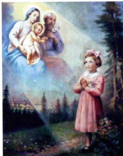
L'apparizione della Sacra Famiglia alla piccola Adelaide Roncalli

mento più cruento della città. Duecento morti, centinaia di abitazioni distrutte o danneggiate. Colpiti il centro di Brescia, la zona industriale, la stazione ferroviaria, e i principali stabilimenti impegnati nelle produzioni di armamenti: Breda, Togni e Tempini. Le bombe lesionarono anche il cimitero Vantiniano, la cupola del Duomo e la biblioteca Queriniana che perse migliaia di volumi.