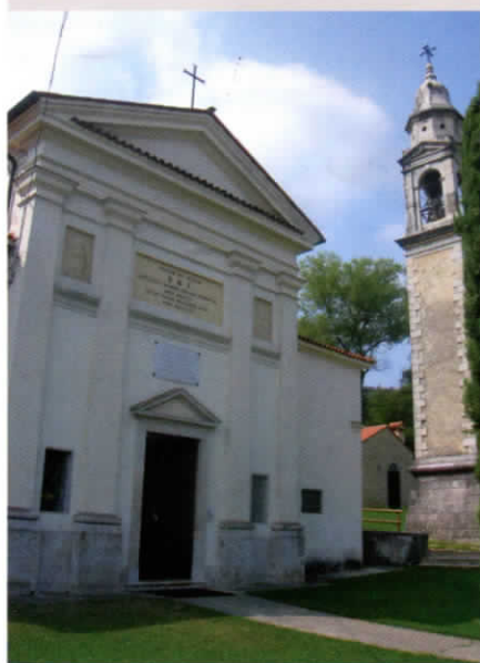
Il Santuario della Madonna dell'Angelo a Piovene Rocchette

“ Il 4 luglio 1944, a Piovene Rocchette (Vicenza), per iniziativa di alcune pie donne, ebbe inizio la Novena di pellegrinaggio al Santuario della Madonna dell'Angelo per supplicare la Vergine ad affrettare l'avvento della sospirata pace ”