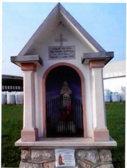
Il Capitello, oggi, dopo alcuni lavori di ristrutturazione