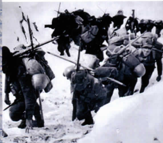
Soldati italiani sul fronte del Don, nel dicembre 1942