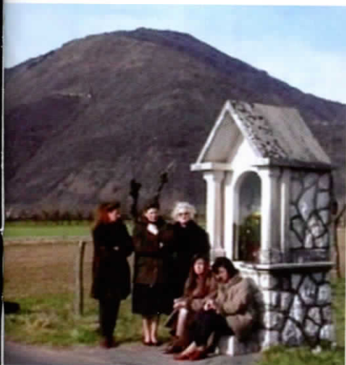
Il monte Summano visto dalla strada che porta al Capitello