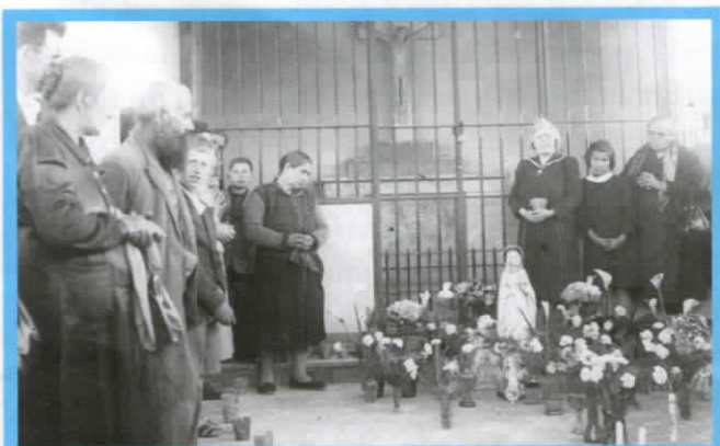
La gente sui luoghi delle apparizioni in un'immagine del 1958