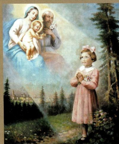
Il quadretto della 1a apparizione esposto alla cappelletta

donna apparsa allora; la pietra su cui saliva la bambina durante le apparizioni; e persino il vicino cartello stradale con la scritta "Cappella delle apparizioni"! C'è anche il problema del grande quadro del pittore Galizzi, dipinto in presenza di Adelaide, che dall'Istituto Sacra Famiglia di Martinengo (BG) è stato recentemente trasferito nella sagrestia della chiesa parrocchiale di Ghiaie! Raffigura la Madonna con i colombi in mano, apparsa il 28 maggio 1944. Perché è stato fatto questo passo, se non si deve più parlare di apparizioni? E infine c'è anche la redditizia cancelleria posta sul retro della cappella dove sono proposti "dietro offerta" immaginette, statue, ricordini, ceri, e i libri che si riferiscono a quelle apparizioni! Credetemi ci si trova veramente disorientati. "La sensazione è che l'autorità della Chiesa contemporanea, almeno in parte, non creda più di tanto agli interventi soprannaturali o perlomeno li consideri scomode sovrapposizioni ai propri programmi pastorali" , sono parole di