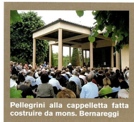
Pellegrini alla cappelletta fatta costruire da mons. Bernareggi

Una decisione scontata, perché non potevano di certo sconfessare né l'opera inquisitoria di don Luigi Cortesi, né il lavoro della Commissione Vescovile, né quella del Tribunale ecclesiastico di allora. Altrimenti avrebbero dovuto approvare le apparizioni e chiedere scusa pubblicamente del male fatto alla povera veggente.