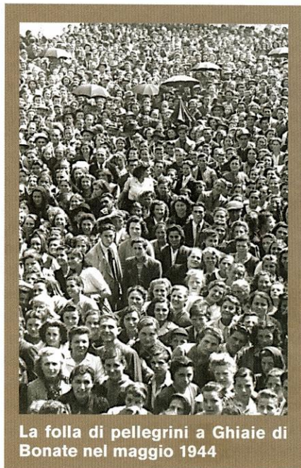
La folla di pellegrini a Ghiaie di Bonate nel maggio 1944

Visto l'incessante flusso di pellegrini a Ghiaie di Bonate (si parla di alcune centinaia di migliaia di persone all'anno), si doveva per forza un giorno o l'altro giungere a qualche compromesso che accontentasse sia i contrari sia i favorevoli al riconoscimento delle "apparizioni" del maggio 1944.