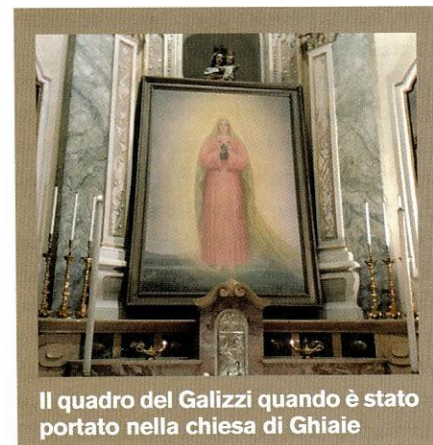
Il quadro del Galizzi quando è stato portato nella chiesa di Ghiaie

donna apparsa allora; la pietra su cui saliva la bambina durante le apparizioni; e persino il vicino cartello stradale con la scritta "Cappella delle apparizioni"! C'è anche il problema del grande quadro del pittore Galizzi, dipinto in presenza di Adelaide, che dall'Istituto Sacra Famiglia di Martinengo (BG) è stato recentemente trasferito nella sagrestia della chiesa parrocchiale di Ghiaie! Raffigura la Madonna con i colombi in mano, apparsa il 28 maggio 1944. Perché è stato fatto questo passo, se non si deve più parlare di apparizioni? E infine c'è anche la redditizia cancelleria posta sul retro della cappella dove sono proposti "dietro offerta" immaginette, statue, ricordini, ceri, e i libri che si riferiscono a quelle apparizioni! Credetemi ci si trova veramente disorientati. "La sensazione è che l'autorità della Chiesa contemporanea, almeno in parte, non creda più di tanto agli interventi soprannaturali o perlomeno li consideri scomode sovrapposizioni ai propri programmi pastorali" , sono parole di