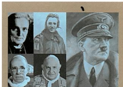
Personaggi di portata storica rilevante intervenuti nella vicenda Ghiaie