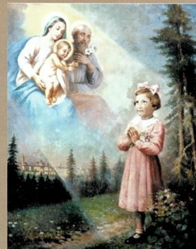
Un dipinto raffigurante la prima apparizione del 13 maggio 1944