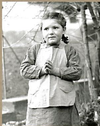
Adelaide in preghiera, i primi giorni delle apparizioni nel maggio 1944

delineò la Sacra Famiglia. La visione era sospesa a 3 metri di altezza, poco distante dai fili della luce.