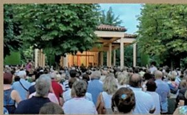
Fedeli alla prima messa del vescovo alla Cappelletta nel 2019